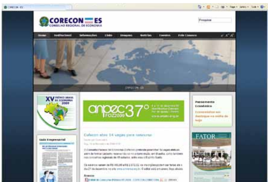
A reestruturação do portal do Corecon/ES agilizou a troca de informações com os associados

A partir da reestruturação, o site passou a utilizar uma aplicação – uma das mais modernas do mundo para portais – que possibilita uma série de expansões, especialmente no que diz respeito a canais de relacionamento entre o Corecon/ES e seus associados.